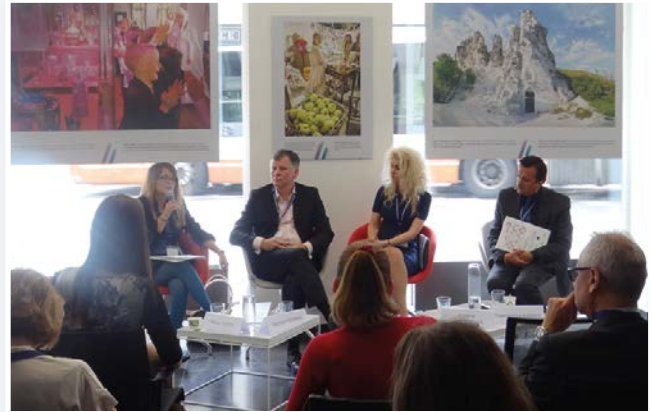
Sesión de la Jornada "Private Money for Public Good? A multi-stakeholder approach to promote social innovation from a disability perspective", celebrada en Philanthropy House, Bruselas, el 7 de mayo de 2015.

La Red Europea de RSE+D ha puesto en marcha la plataforma Agora+D , un proyecto ambicioso que nace con la idea de generar debate y sensibilización y promover el aprendizaje mutuo, a través de un espacio de intercambio de buenas prácticas provenientes de organizaciones punteras tanto del sector público como privado, relativas a la integración de la dimensión de la discapacidad en sus estrategias de RSE, innovación y emprendimiento social.