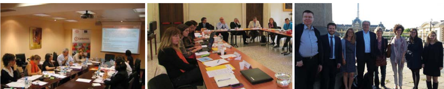
Ejemplos de encuentros de los socios de las Redes (de izquierda a derecha): InNet 16 en Madrid, 2011; RSE+D en Roma, 2013; e incluD-ed en París, 2015.

Son múltiples los ejemplos que podrían mencionarse, destacando aquí solo algunos como la participación de la Red Europea de RSE+D en las consecutivas conferencias del emblemático Zero Project promovido por Essl Foundation, la presentación de esta misma Red en el Grupo de Alto Nivel sobre RSE de la Comisión Europea en 2012, la participación de InNet 16 en 2013 en el encuentro auspiciado por el Ministerio de Infraestructura y Desarrollo de Polonia sobre Discapacidad y Fondo Social Europeo (mencionado en páginas anteriores), o la presentación de incluD-ed como experiencia destacada en el encuentro de Alto nivel sobre Discapacidad celebrado por la Presidencia letona de la UE en mayo de 2015 ("High level meeting on Disability: from Inclusive Education to Inclusive Employment for People with Disabilities").