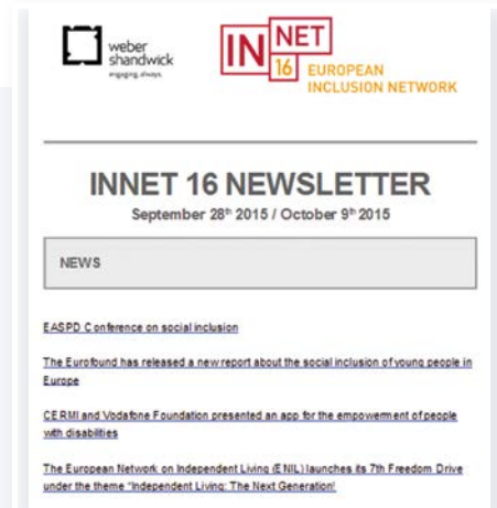
Imagen de portada de las Newsletters de las Redes RSE+D, incluD-ed e InNet 16.

Adicionalmente, las Redes se han sumado a las redes sociales, como el caso de la Red de RSE+D e incluD-ed, con seguidores que se han ido incrementado en el tiempo superando el medio millar (@incluD-ed y @csrd_eu en Twitter, o incluD-ed Network en Linkdin).