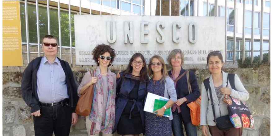
Representantes de los socios fundadores de incluD-ed, y de su Secretaría Técnica, durante la visita de estudio a UNESCO en París, el 8 de junio de 2015.

Igualmente con el fin de favorecer el intercambio de experiencias y buenas prácticas, así como el aprendizaje mutuo, la Red incluD-ed ha desarrollado Visitas de Estudio. Destacan las visitas realizadas en Helsinki en mayo de 2014 en las que, bajo el auspicio del socio finlandés Kynnys ry, el conjunto de socios de la Red pudo conocer de primera mano algunas de las experiencias e instituciones más significativas en el ámbito educativo del país, de referencia en Europa, así como los avances y desafíos en relación con la educación inclusiva.