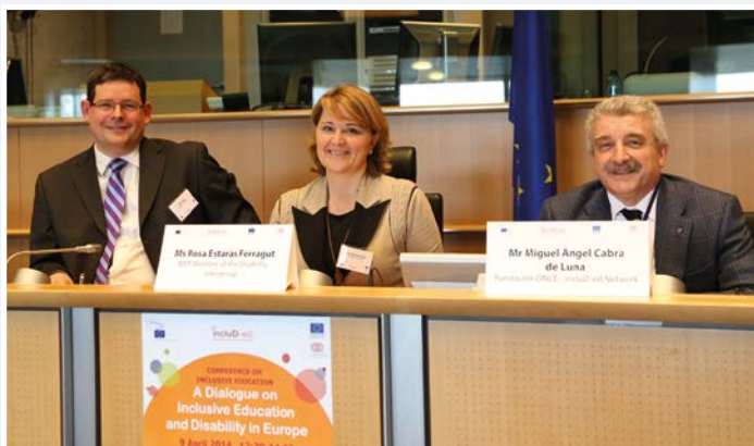
Mesa inaugural de la Conferencia, con (de izquierda a derecha) los Europarlamentarios Ádám Kósa y Rosa Estaràs, y con Miguel Ángel Cabra de Luna, Director de Relaciones Sociales e Internacionales y Planes Estratégicos de la Fundación ONCE, en representación de incluD-ed.

europayo en el campo de la educación inclusiva. Como producto de la Conferencia, se elaboró un vídeo divulgativo del evento, incluyendo una serie de entrevistas a los ponentes y participantes, sobre la educación inclusiva en Europa.