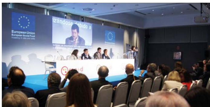
Sesión inaugural de la presentación institucional de la Red Europea de RSE+D, celebrada el 23 de Abril de 2012 en Madrid.

plataforma que reúne en conjunto a más de diez mil empresas europeas. El evento, al que acudieron más de 200 representantes de empresas, administraciones públicas, y entidades sociales, sirvió para presentar formalmente la Red, enfatizándose su rol como actor relevante para contribuir a la incorporación de la discapacidad en las agendas de RSE, y destacando la importancia de esta RSE como elemento para fomentar la inclusión social y laboral de las personas con discapacidad en Europa.