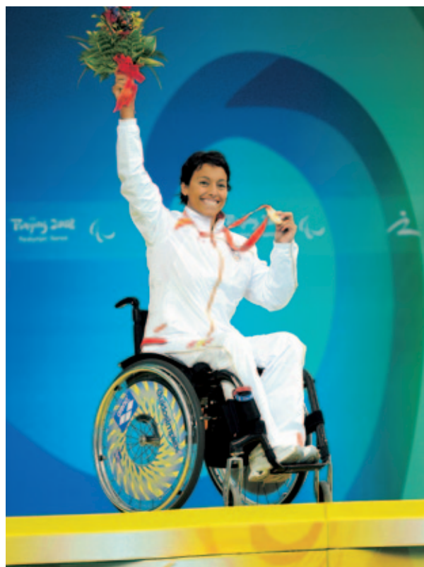
Teresa Perales, oro en los 100 metros libres en Beijing (Pekín), 2008.

Juegos Paralímpicos. Competición deportiva internacional del más alto nivel en la que participan atletas con discapacidad. Se celebraron por primera vez en el año 1960, y en la actualidad se celebran cada cuatro años en la misma sede que los Juegos Olímpicos unos días más tarde.