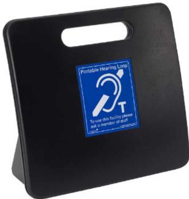
Figura 6: bucle magnético de tipo portátil.

Fuente: Gobierno de Canarias, Consejería de Educación, FP, Actividad Física y Deportes, “Bucles magnéticos Receptor/Emisor”, https://www3.gobiernodecanarias.org/medusa/ecoescuela/centrorecursos/?product=neae-57 , [Consultado: 19-02-2024].