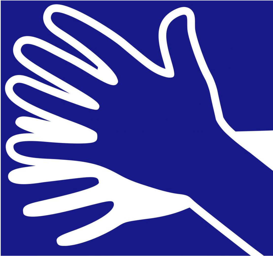
Figura 3: logo internacional identificativo de la LS 407 .