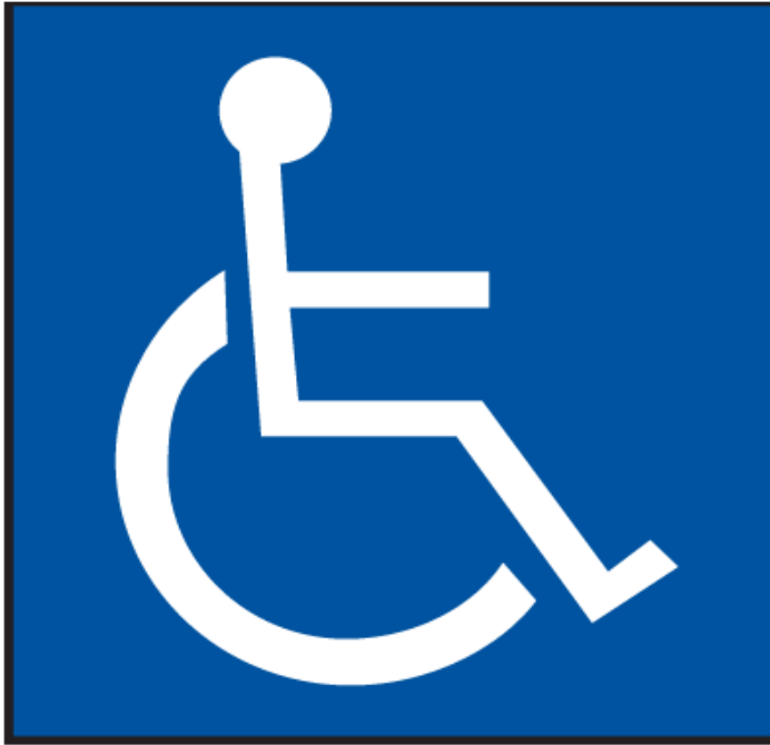
Figura 1: SIA clásico, inspirado en modelo médico-rehabilitador 80 .