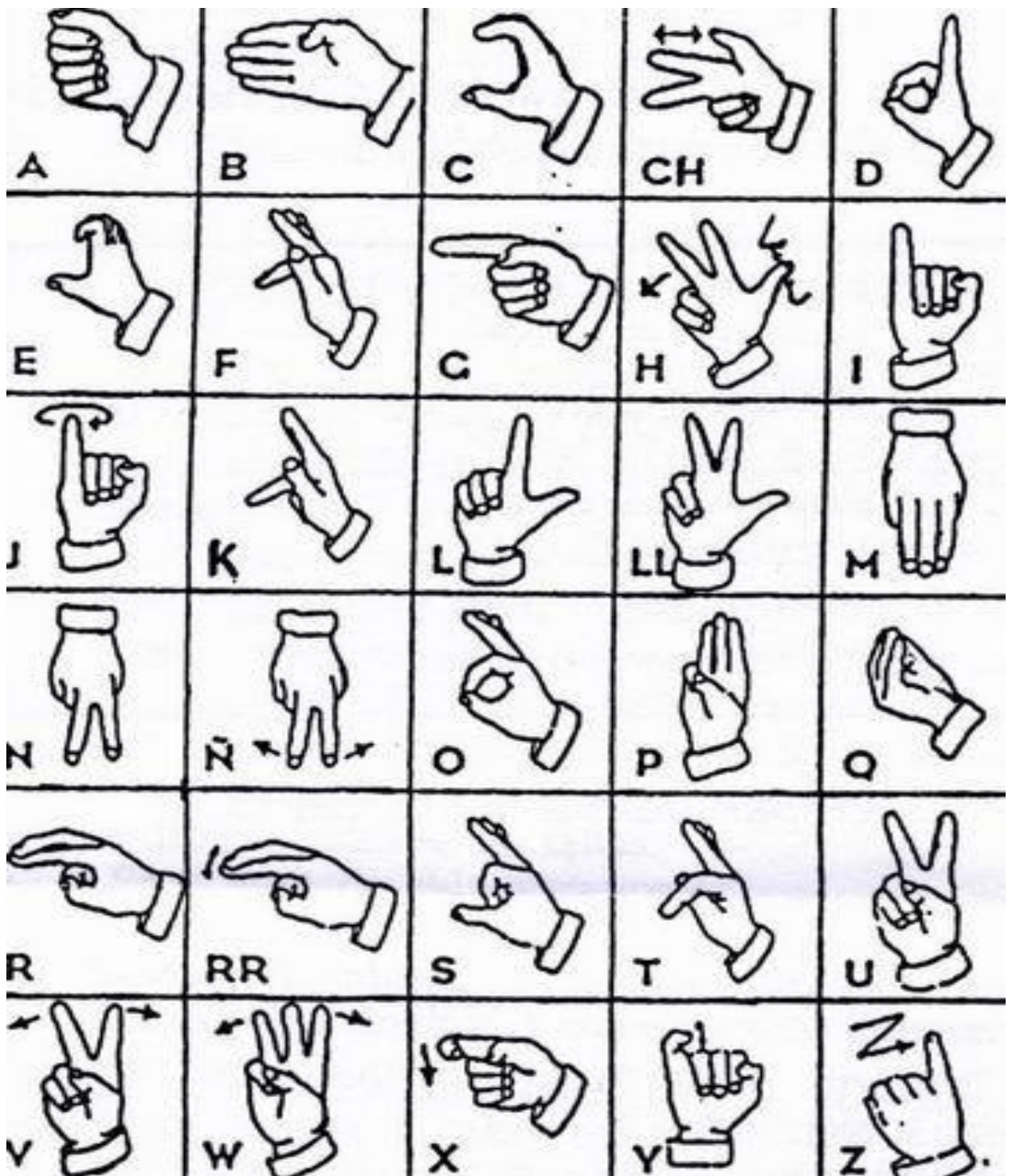
Figura 4: alfabeto dactilológico de la LSE.

Fuente: Miguel Hernández, "Abecedario en el lenguaje de señas"