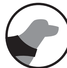
Perros de asistencia