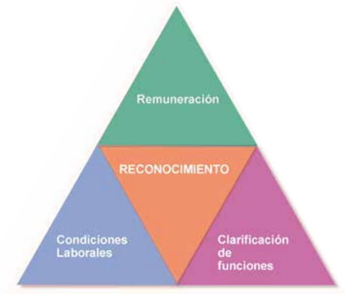
Figura nº 6. Ámbitos de mejora en las condiciones laborales de los asistentes personales.

En lo que se refiere a la modalidad laboral, las experiencias analizadas se realizaron desde entidades del Tercer Sector de Acción Social y, en general, las asistentes personales formaban parte de la plantilla. Ello permitió que las condiciones laborales de las trabajadoras se hubieran adaptado a las peculiaridades del trabajo de un modo bastante aceptable.