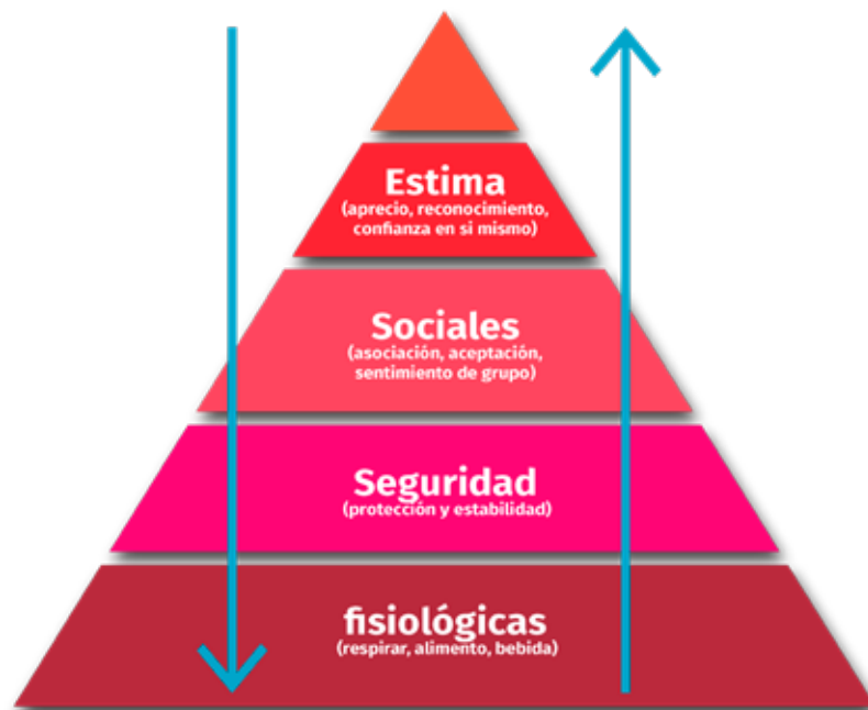
Fig 1. Elaboración propia según la pirámide de jerarquía de necesidades humanas de Abraham Maslow

En una interpretación más centrada en la idea de persona, son las necesidades de autorrealización las que orientan, gobiernan y dirigen el resto de áreas de la pirámide. Porque como dice María Zambrano, aludiendo a un dicho andaluz, “en mi jambre mando yo, había contestado aquel sin trabajo cuando le fueron a proponer algo que no era de su agrado” 14 .