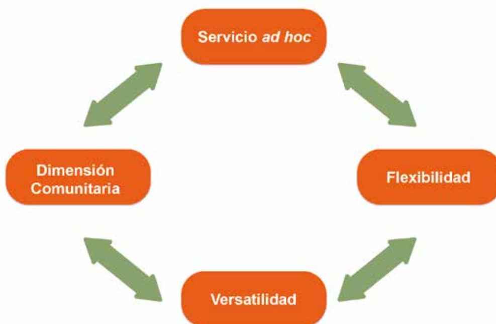
Figura nº 3.

Por las ventajas que ofrece el servicio, como su flexibilidad y adaptación al contexto y al tipo de usuario esta prestación puede extenderse, sin duda, a otros colectivos. El mayor problema con el que puede encontrarse esa extensión, según manifiestan la mayoría de los entrevistados y participantes en los grupos, tiene que ver con el gran esfuerzo económico que supone para los usuarios.