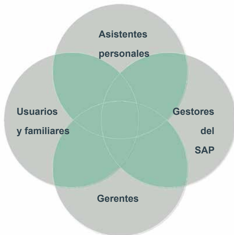
Figura nº 2. Tipos de grupos de discusión.

Analizadas las informaciones resultantes de la primera parte del estudio de campo, se pudieron seleccionar los asuntos más relevantes y críticos en torno al SAP y se entendió que sería muy enriquecedor someter estos asuntos a la reflexión y discusión compartida de los distintos implicados. Para ello se plantearon cuatro grupos de discusión conformados por 17 representantes de los principales actores implicados en el diseño, gestión, prestación y recepción del servicio: usuarios y familiares, asistentes personales, gestores del SAP, y gerentes de las entidades que forman parte del proyecto piloto (figura nº2). El valor de los grupos de discusión reside en que trasciende el discurso individual y se van conformando, a través de la interinfluencia de los participantes, las ideas más o menos compartidas, las representaciones “sociales” de los temas tratados, tal y como ocurre en la vida cotidiana, puesto que nuestras percepciones e ideas se van conformando en continua interacción con nuestro entorno. La dinámica de diálogo y reflexión que se genera en las discusiones grupales, guiadas por un moderador, ayuda a aflorar las motivaciones, ideas, valoraciones, percepciones... en un formato determinado por la presencia de otras personas con las que se comparte rol y/o situación. La riqueza y espontaneidad de los discursos que se suceden en estos grupos hacen que la información que aportan sea muy relevante y significativa.