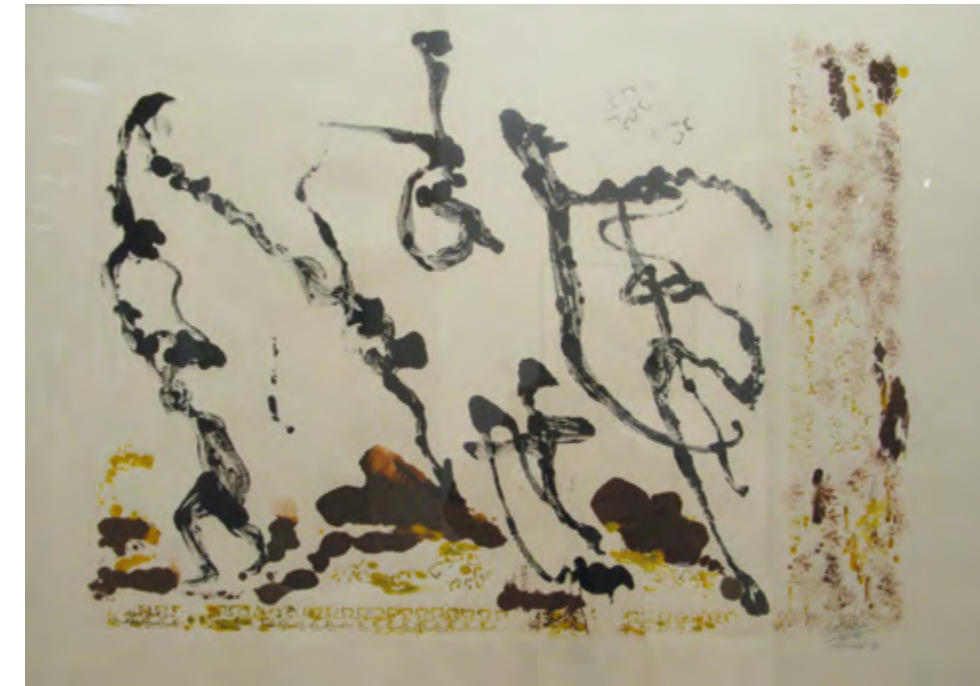
NIGERIA 2011 Impresión monotipo con tres tintas y estarcido. Tintas acrílicas y aluminio