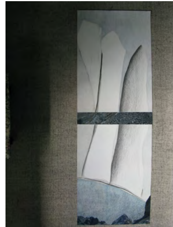
ICEBERG Técnica mixta. Grafito, pastel, fotografía y aluminio