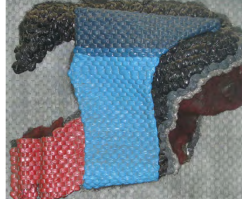
MOVIMIENTO SÍSMICO 1989 Tapiz. Red de alambre, acrílicos, fibra de vidrio, resina de poliéster, fibras metálicas y madera