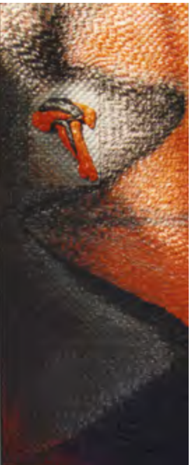
LA MOSCA 1990 Tapiz. Red de alambre, plástico, acrílico, fibra de vidrio, arenas y madera