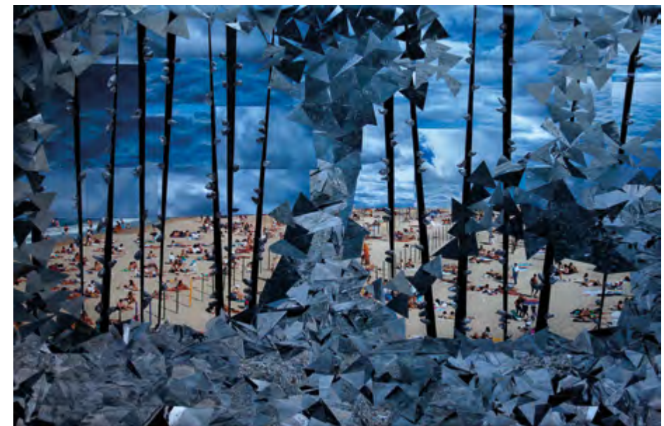
CATACLISMO 2015 Técnica mixta. Fotografías, acrílicos, tinta y aluminio

Finalmente, la muestra no se ajusta a cánones de formato, técnicas, materiales, ni tan siquiera de estilo; los trabajos se realizan en distintos momentos de la vida de su autora, lo que refleja su visión del entorno que la rodea y su modo de plasmarlo materialmente en cada momento, dando una visión de conjunto de su personalidad e inquietudes, que quiere compartir con los observadores, tratando de ampliar sus emociones y disfrute ante los trabajos exhibidos.