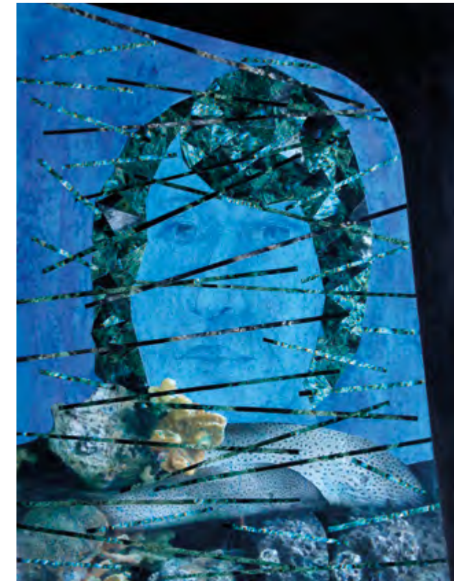
AL FINAL DEL TÚNEL 2004 Técnica mixta. Fotografías, grafito, acrílicos, alquitrán y tintas