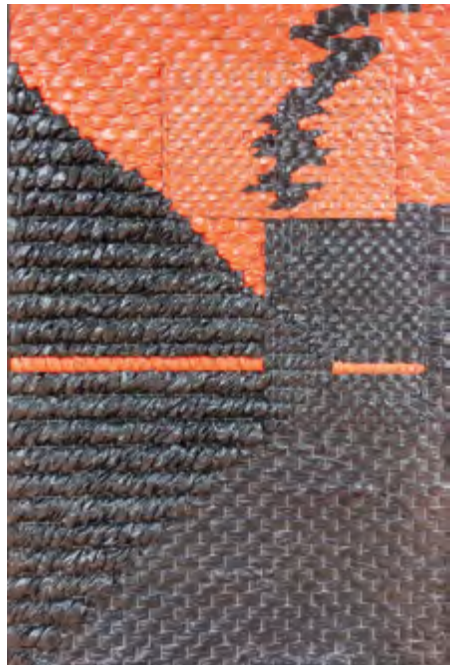
RAYO 1991 Tapiz. Red de alambre, plástico, acrílico, aluminio