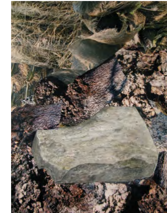
UMBRÍA Técnica mixta. Fotografías, grafito, pastel, goma arábiga y madera