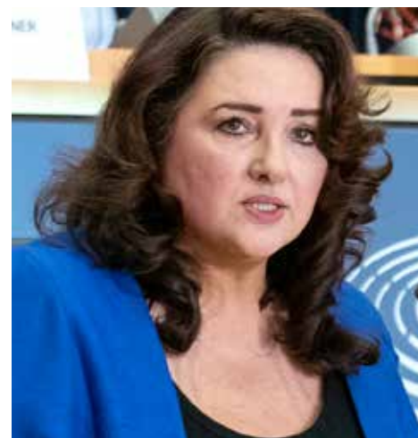
La comisaria europea de Igualdad, Hellena Dalli, afirmó que "nadie debe quedarse atrás" en la recuperación de la pandemia.

La Unión por el Mediterráneo es la única organización intergubernamental euromediterránea que reúne a los países de la Unión Europea y 15 países del sur y este del Mediterráneo. La UpM proporciona