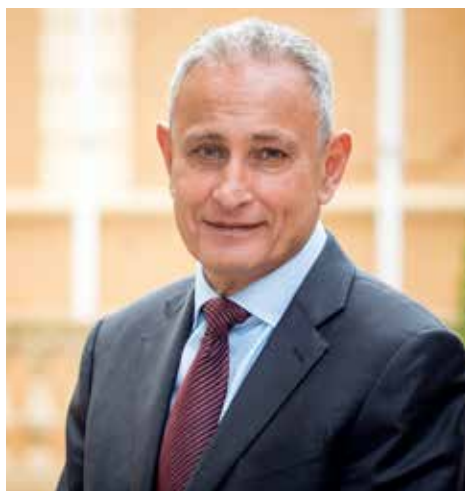
El secretario general de la UpM, Nasser Kamel, destacó que "la pandemia ha exacerbado las desigualdades y las barreras".

nea, la participación de las personas con discapacidad en los mercados laborales es extremadamente baja.