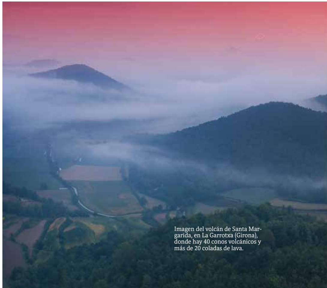
Imagen del volcán de Santa Margarida, en La Garrotxa (Girona), donde hay 40 conos volcánicos y más de 20 coladas de lava.

Es en Canarias donde se encuentran los cinco volcanes activos que hay en España: El Teneguía y el Cumbre Vieja, en La Palma; el Tagoro, en El Hierro; el Teide, en Tenerife, y el Timanfaya, en Lanzarote.