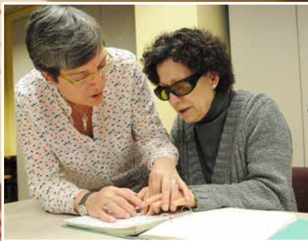
Una profesora de braille enseña a leer con las manos a una persona con discapacidad visual.