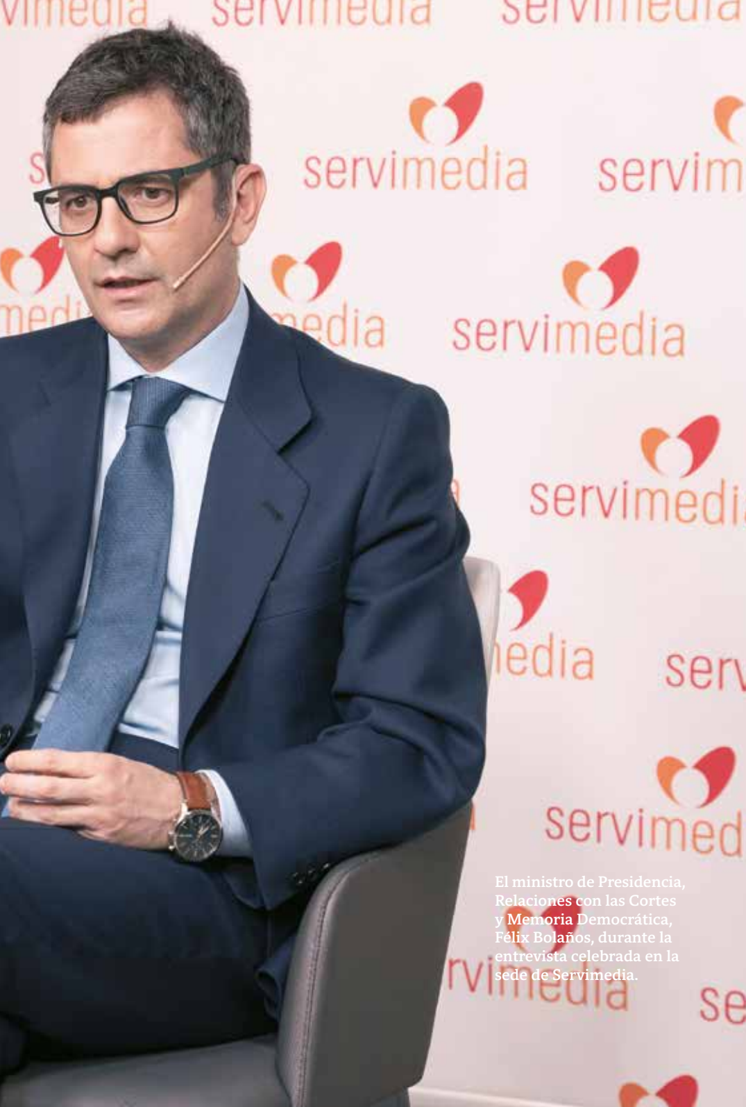
El ministro de Presidencia, Relaciones con las Cortes y Memoria Democrática, Félix Bolaños, durante la entrevista celebrada en la sede de Servimedia.