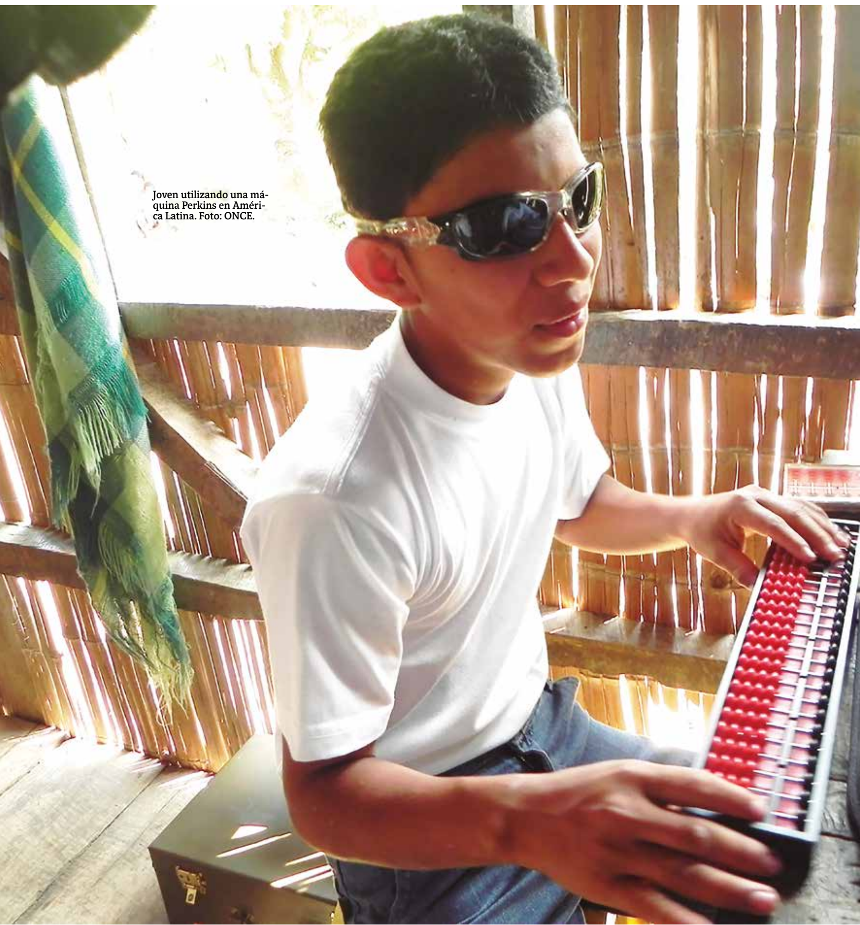
Joven utilizando una máquina Perkins en América Latina.