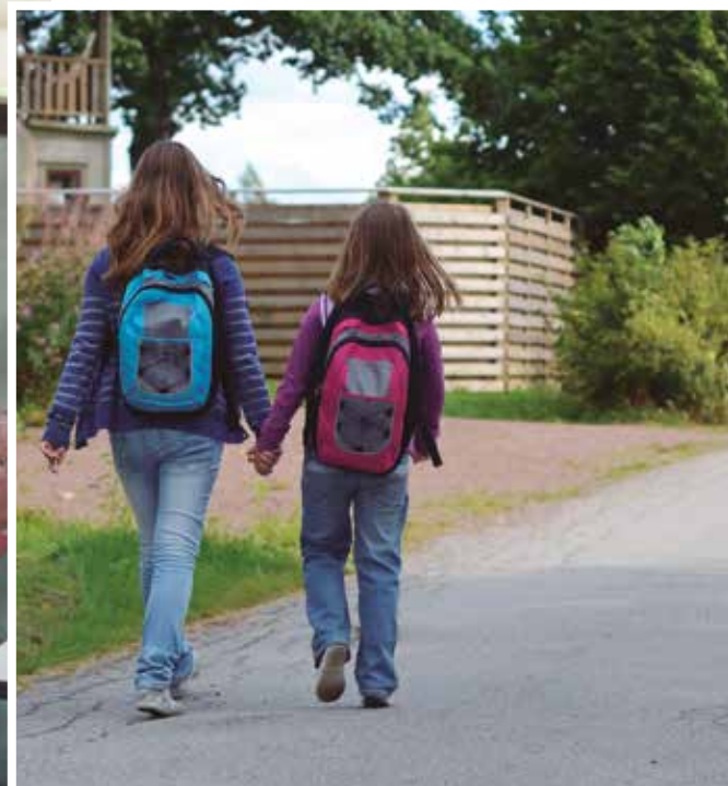
Dos niñas caminan, en la imagen superior, hacia el colegio en un pueblo. A la izquierda, sillas-pupitres abandonadas en una escuela.

efecto del nivel socioeconómico, incluso los superan".