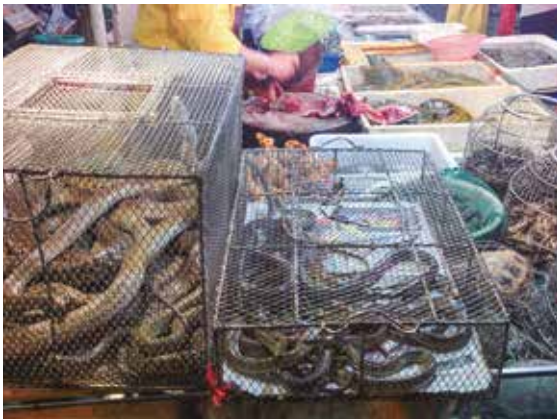
A la izquierda, imagen del 'mercado húmedo' de Huanan, en el que se inició el coronavirus y donde un carnicero tostaba con un soplete patos y perros. Sobre estas líneas, imágenes de animales salvajes (serpientes y tortugas, entre otros) en otros mercados chinos.

La situación vivida en los hospitales fue dramática, al igual que en las residencias de mayores. ►