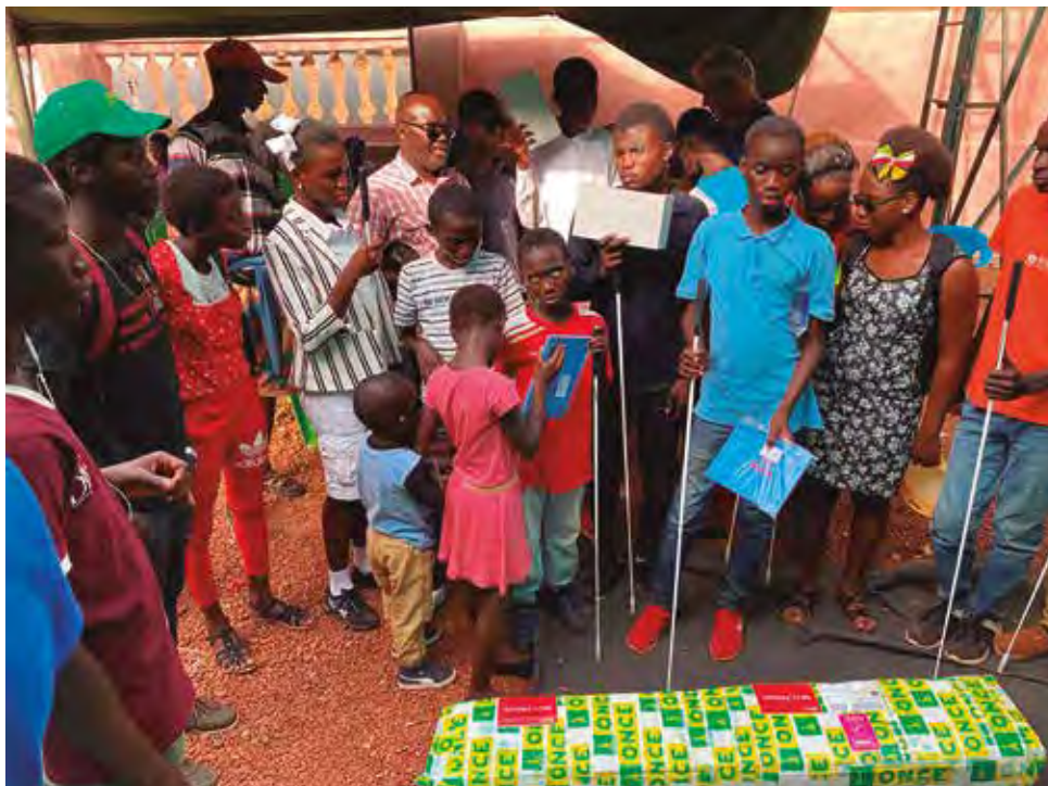
Niños y personas ciegas reciben en Guinea Bissau el material remitido por el Grupo Social ONCE.

► do los compromisos del Programa Iberoamericano de Discapacidad (PID), del que el Grupo Social ONCE es su unidad técnica.