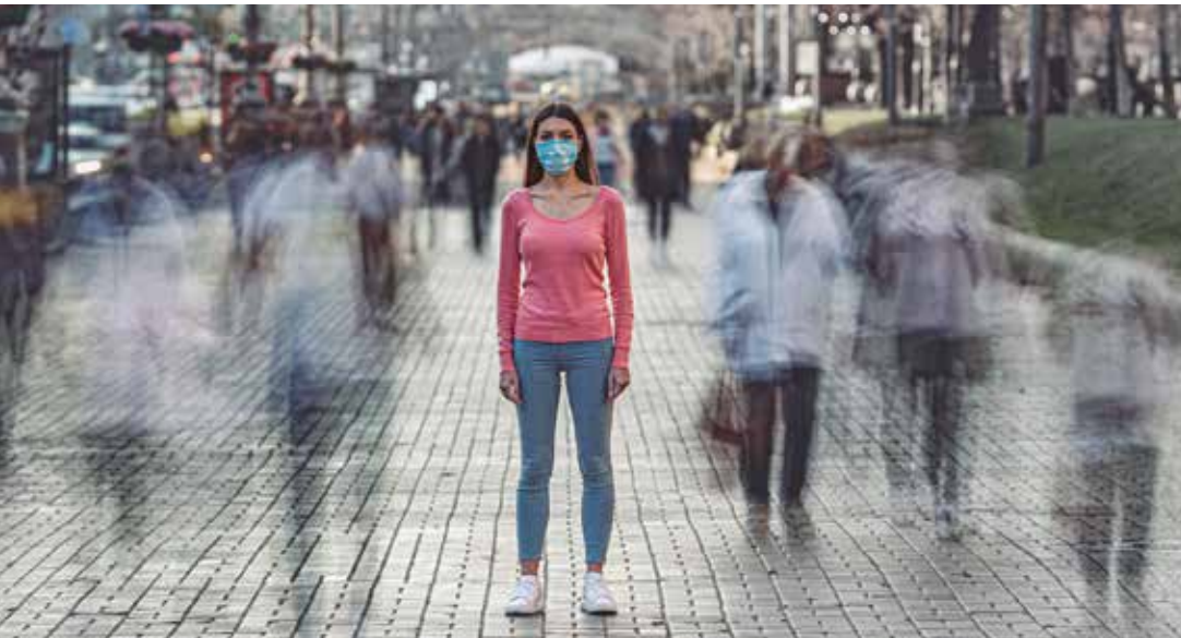
La fatiga pandémica afectó a gran parte de la población. Uno de cada tres españoles tuvo ansiedad, uno de cada cuatro depresión y la mitad de la población problemas de sueño.