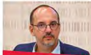
CARLES CAMPUZANO Expresidente Comisión