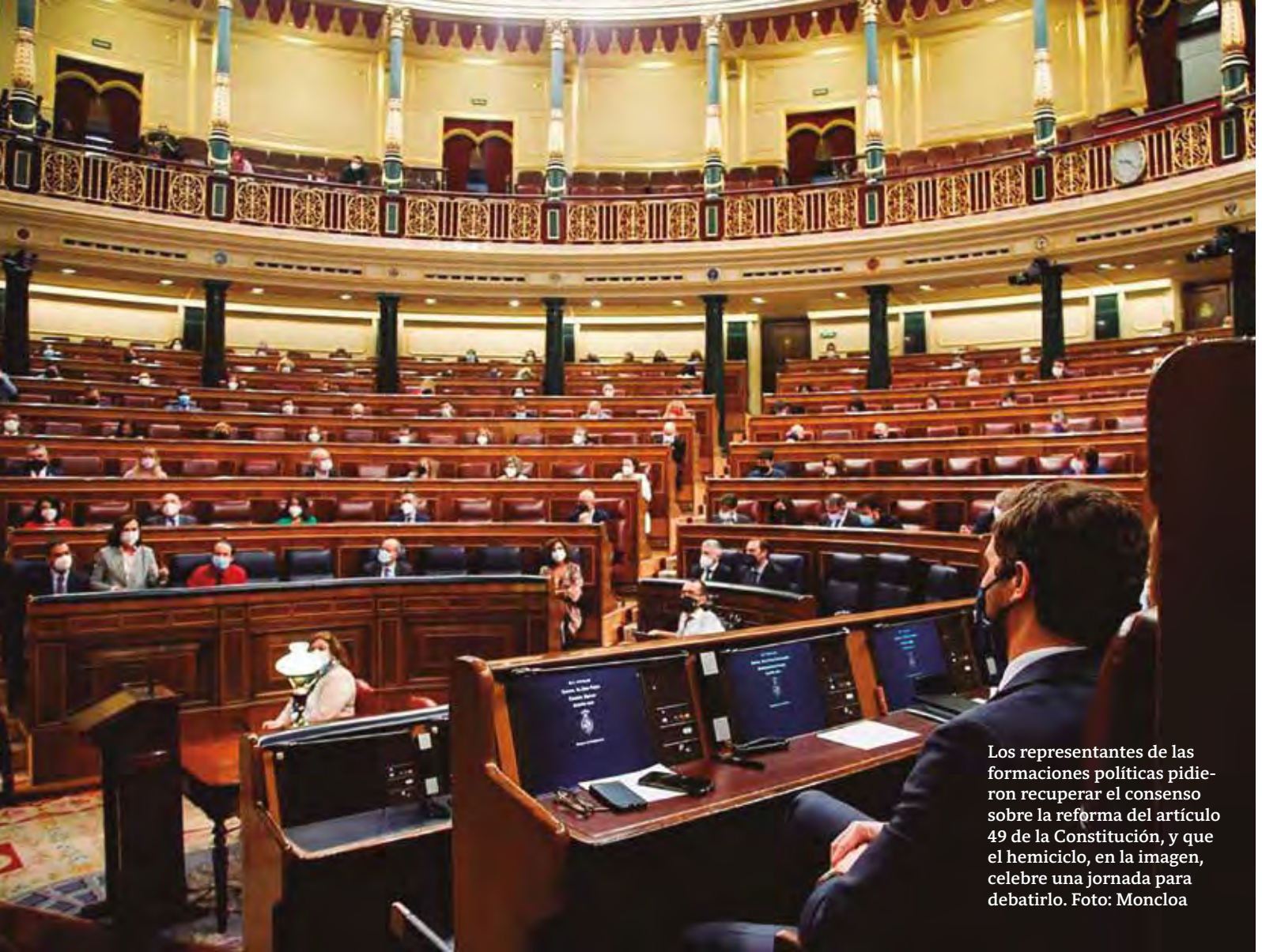
Los representantes de las formaciones políticas pidieron recuperar el consenso sobre la reforma del artículo 49 de la Constitución, y que el hemiciclo, en la imagen, celebre una jornada para debatirlo.