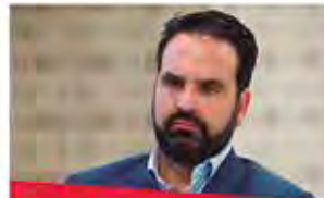
ÍÑIGO ALLI Exdiputado UPN