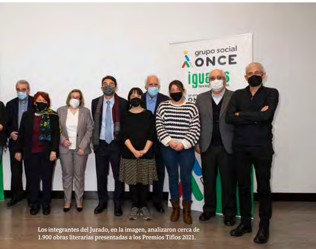
Los integrantes del Jurado, en la imagen, analizaron cerca de 1.900 obras literarias presentadas a los Premios Tiflos 2021.